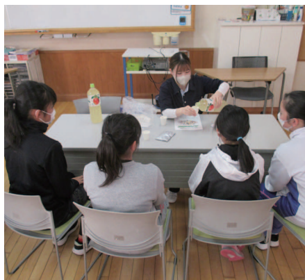
「とろみ剤」を入れたジュースを飲んでみよう

2024年11月14日、東通村小学校5～6年生を対象に、仕事前体験授業『ユメココ教室』が開催されました。