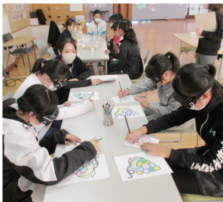
見えづらいゴーグルをつけて塗り絵に挑戦