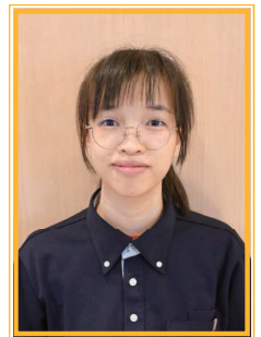
出身地 ベトナム社会主義共和国 トアティエンフエ省

私は介護職として一年働いていまして、職員はとも親切で、いつも仕事や日本語を教えてくれます。この仕事は利用者とのコミュニケーション、日本語が多くの必要なので、日本語を勉強して勉強することが大切です。介護に関する知識も非常に重要です。女性の介護福祉士の資格を取りますために勉強を頑張ります。専門用語は難しく、とても不安ですが、日本語を勉強したいので、日本語を勉強したいです。たしなみの自筆です。