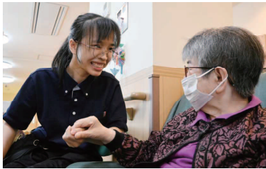
方言も少しですが話せます！